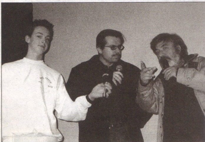
RADIO FRECH (BRG und MRG Linz, Fadingerstraße)